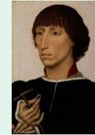
Portrait du Duc d'Este, vers 1460, huile sur bois, Roger van der Weyden, New York Metropolitan museum

Edgar Degas était un peintre, un graveur, un sculpteur et un photographe. Artiste prolifique et novateur de la fin du XIX siècle, il signe une œuvre d'une grande modernité. Observateur exigeant, esthète passionné par le mouvement, il nous livre des instants captés, des images qui sont d'une grande poésie.