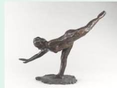
Danseuse 1882, bronze, 45 cm, Edgar Degas, musée d'Orsay

Les Primitifs sont des peintres de la période médiévale et du début de la Renaissance : Ils vont faire évoluer la peinture religieuse et sont à l'origine des premiers portraits. Ils s'attachent à représenter une réalité en volume et en perspective. De Cimabue à Della Francesca, regardons l'évolution de la peinture italienne entre le XIII et le XV siècles avec quelques œuvres clés.