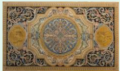
Tapis, 1686, 5.2 x 8.7 m, Château Royal de Versailles

Observons des œuvres d'art asiatique grâce aux collections du musée Guimet : hauts-reliefs afghans, sculptures et marquetterie pakistanaïses, peintures mogholes, bijoux indiens, et statuaire khmer. Un fabuleux voyage dans les cultures et mythologies de l'Asie.