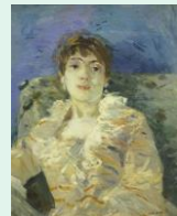
Jeune femme sur un divan, 1885, huile sur toile, Berthe Morisot, Londres Tate collection

Contemplant des œuvres d'art coréennes, chinoises et japonaises provenant des collections du musée Guimet : porcelaines décorées de fleurs, vaisselle Céladon, sculptures en bois doré, statuettes Mingki, coffres en bois laqués, vases en jade, pierres de Lettrés, paravents en soie, kimonos, parures.