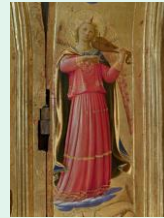
Retable XV s, Fra Angelico, Musée national San Marco

Nous connaissons assez bien les peintres impressionnistes, mais qu'en est-il des femmes qui ont pratiqué cette peinture et qui ont même participé aux expositions du groupe ? Retraçons les itinéraires de ces peintres : Suzanne Valadon, Eva Gonzales, Marie Bracquemond et Mary Cassatt.