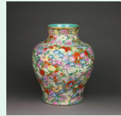
Vase chinois, porcelaine XVI s, musée Guimet

Le mobilier et la décoration de la période « Classique » : Répertoire des formes, couleurs, matières, motifs, pour mieux identifier les programmes décoratifs des styles Louis XIII à XV en regardant fauteuils, canapés, tables, consoles, tapis et tapisseries, boiseries, et cheminées.