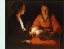
Nativité (Le nouveau né) vers 1645, Georges de la Tour, musée des Beaux arts de Rennes

Le Fauvisme est un mouvement né vers 1900 autour d'Henri Matisse. Derain, de Vlaminck, Van Dongen, exposent ensemble en 1905 et leurs peintures font scandale : on les surnomme « les Fauves »... parce que les couleurs rugissent dans leurs tableaux ?