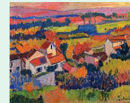
Paysage près de Chatou, 1904, André Derain, coll. Part.

La peinture flamande est associée au XV, XVI et XVII s. Ceux qui initient la période et qu'on appellera les primitifs flamands se lancent dans la conquête du réalisme spatial et de l'illusionnisme des matières. Découvrons quelques-uns de ces peintres talentueux au travers d'une sélection d'œuvres.