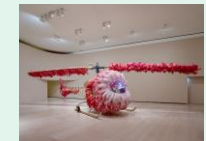
Lilicoptère, installation, L 12 m, 2012, Joana Vasconcelos

Les peintres du XVII s en France sont répartis entre 2 styles : classique et baroque. Certains comme Simon Vouet ou Charles Le Brun, prônent une peinture aux couleurs riches et lumineuses, d'autres comme Georges de la Tour ou Valentin de Boulogne, s'inspirent du Caravage pour jouer avec l'ombre et la lumière. Observons quelques-unes de leurs œuvres.