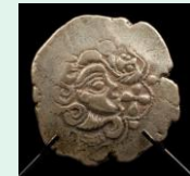
Statère gaulois en electrum, Paris, Inra

Edouard Manet est un peintre du groupe des Impressionnistes. Ses toiles représentent des moments captés, intimes, avec des références aux grands modèles classiques qu'il réinvente, et modernise. Sa peinture nous replonge dans la vie et les mœurs du XIX e siècle.