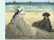
Sur la plage, huile sur toile, Edouard Manet (Paris, musée d'Orsay)

Au Moyen Âge, le travail du cuivre, de l'étain, de l'argent, de l'or et de l'émail nous a légué des trésors : vaisselle, bijoux, objets liturgiques, et statuettes. Nous observerons des pièces de la période mérovingienne à la période gothique. Le musée du Louvre et le musée de Cluny seront nos médiateurs dans cette découverte de l'orfèvrerie médiévale.