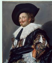
Cavalier riant, huile sur bois, 1624, Frans Hals (Londres, Wallace collection)

Chagall, peintre et décorateur de la « Surréalité » appartient aux artistes dit de l'école de Paris. Sa peinture onirique et poétique nous transporte en enfance, dans sa région, à travers ses souvenirs. Ses toiles sont une invitation au réenchâtement de la vie.