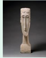
Tête de femme 1912, calcaire, Amadeo Modigliani (Philadelphie, fondation Barnes)

Je vous propose de découvrir plusieurs artistes néerlandais dont Frans Hals remarquable représentant de la peinture hollandaise du XVII e siècle. Maître dans l'art du portrait et de la scène de genre, cet artiste se distingue de Rubens ou de Rembrandt, qui vivaient à la même époque que lui, par sa touche vive et ses modèles expressifs qui sourient !