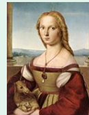
Huile sur toile

Modigliani est un artiste de l'école de Paris. Ses peintures et ses sculptures ont une aura mystérieuse. Ami de Picasso, Juan Gris et Diego Ribera, il fit scandale à son époque avec sa manière de représenter des visages sans regard ou des femmes à la sensualité affirmée.