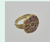
Bague mérovinienne, Entre 480 et 630 de notre ère (Paris, musée du Louvre)

Frida Kahlo est une artiste mexicaine qui mêle dans sa peinture au style naïf, traditions populaires, symbolisme, et références biographiques. Touchée par différentes infirmités, elle fera de son œuvre, l'expression d'une profonde résilience. Proche du mouvement surréaliste, cette personnalité hors-normes, n'a pas fini de vous étonner !